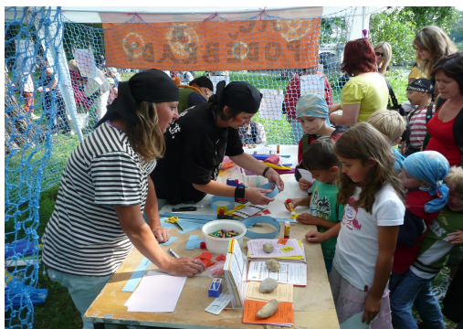
Pirátský den v srpnu