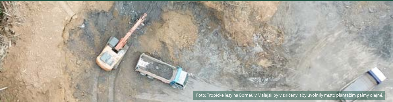
Foto: Tropické lesy na Borneu v Malajsii byly zničeny, aby uvolnily místo plantážím palmy olejně.

výrobků a případů nesouladu. Evropská komise bude povinna každoročně do 30. října zveřejňovat přehled napříč EU na základě zpráv členských států. Komise na svých internetových stránkách zveřejní seznam všech porušení EUDR s uvedením příslušné společnosti, data, činnosti, povahy a (případně) uložených sankcí.