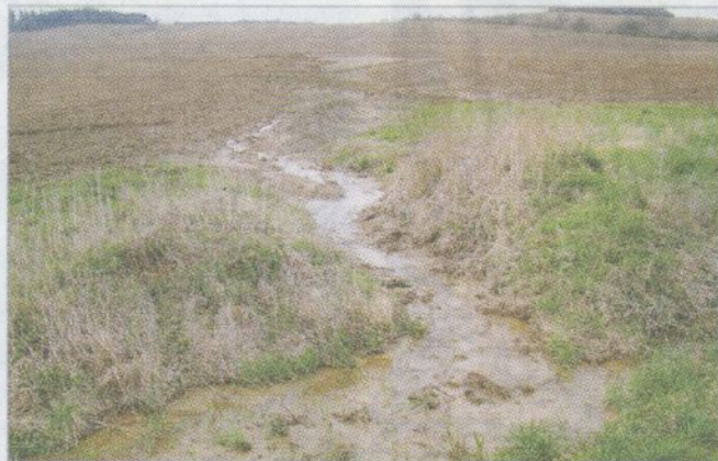
Vodní eroze na pozemku nepřilís svažitém, ale příliš rozsáhlém (Libina, duben 2013)

těl a dopouští a která se v minulosti projevovala regionálně a postupně v řádech desetiletí nebo dokonce staletí, se nám dnes vrací během několika málo let. Je to na jedné straně možná poněkud depresivní poznatek, ale na druhou stranu nám může poskytnout naději, že jsme schopni provést i nápravu včas rozpoznávaných špatných rozhodnutí a špatných projektů rovněž během několika málo let. Bohužel, musíme při tom počítat s tím, že následky špatného hospodaření v krajině, jakými jsou například ztráta erodované půdy nebo vyhynutí některých druhů organismů, si vyžadují dobu mnohdy podstatně delší, pokud vůbec jsou tyto procesy vratné. Ztracená retenční kapacita krajiny, kte-