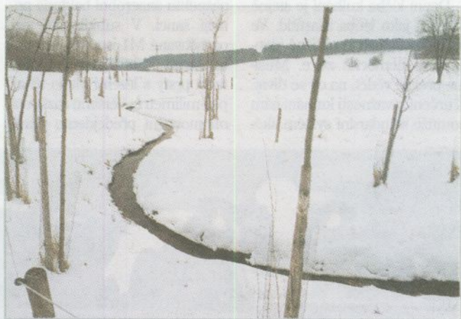
Příklad revitalizace původně zcela regulovaného potoka (Brloh, CHKO Blanský les, 2004)

ly z krajiny. Namísto pramenů a studánek nám zbyly v krajině ohavné betonové roury, které ústí někde na dolním okraji velkého půdního bloku, většinou v houštině kopřiv a černého bezu. V tomto ohledu se dnes nabízí široké spektrum možností a metod, včetně dotací z programů Evropské unie, na základě kterých můžeme vodu vrátit zpět do krajiny a obnovit všechny funkce povrchových vodotečí. A nemusí jít o velké projekty za desítky milionů korun. Často i malý projekt, díky kterému se na povrch dostane několik desítek metrů potoka včetně studánky u jeho pramene, může významně přispět k oživení a ozdravení krajiny. K potokům samozřejmě patří doprovodné dřeviny, stačí vrby a olše, které lze jednoduše ošetřovat a které nemusí stínit okolní pozemky, a samozřejmě by měly být zatravněné zasakovací pásy, jež zamezí znečištění povrchového toku splaveninami. V tomto pro-