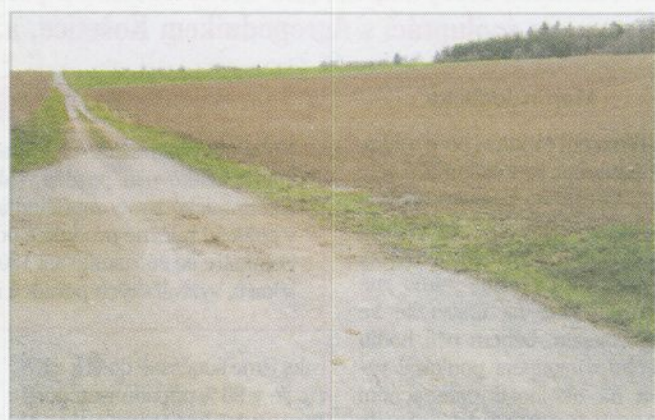
Eroze půdy neznehodnocuje pouze přírodu, ale i cestní síť. V tomto případě jde o komunikaci vybudovanou ze strukturálních fondů Evropské unie (Libina, duben 2013)

Velkou péčí je nezbytné věnovat vodě samotné. Naši předci si nesmírně vážili pramínků a studánek. Údržbu a ochranu studánek a pramenů v krajině považovali po staletí za samozřejmou věc, protože si uvědomovali, že jsou na kvalitní vodě životně závislí nejen oni i jejich hospodářská zvířata, ale udržovaná prameniště mohou být místem s bohatým výskytem i vzácných rostlin (například léčivých bylin) a živočichů. V tomto ohledu u nás docházelo v šedesátých až osmdesátých letech dvacátého století k ničení těchto míst v neuvěřitelném rozsahu. Prameny a pramenné stružky byly uzavřeny do podzemních potrubí a horní části potoků se na stovkách metrů i kilometrech ztráti-