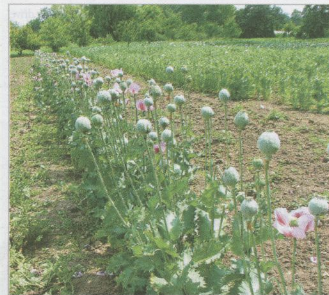
Pás ozimého máku z pozdního výsevu (jediný nepřivalený po výsevu) ochránil jarní mák před napadením krytonoscem makovicovým (Budyně nad Ohří 2010)

E-ventus: ošetření elektronovým zářením, HWT: ošetření horkou vodou, obojí snižuje klíčivost, nutno navýšit výsevek