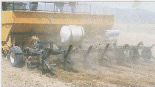
Obr. 2 – Hrázkovací tělesa lze umístit přímo na sázeč a vytvořit tak asi 28 tisíc minirezervoárů na hektar, které zachytí přibližně 56 m 3 srážkové vody

K cílené a přesné aplikaci mulče lze s menšími úpravami využít dostupnou mechanizaci k aplikaci statkových hnojiv, nejlépe rozmetadel s vertikálním