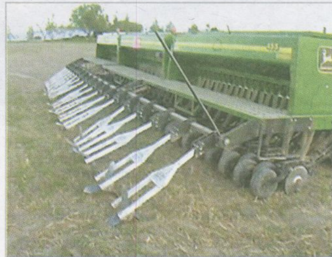
Obr. 3 – Podobné i sečí stroje pro širokořádkové plodiny lze vybavit důlkovacími tělesy

Pokud mulč aplikujeme již po výsadbě, je tedy často potřeba jeho opětovné doplnění, neboť