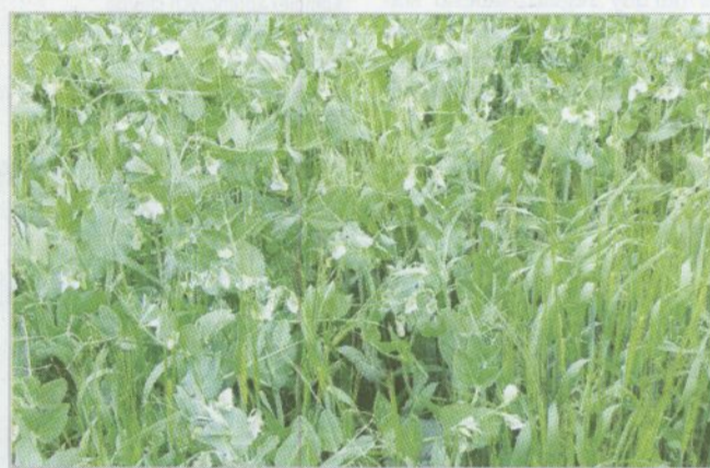
Obr. 2 - Maloparcelkové pokusy - směska hrachu a ječmene

U obilnin pěstovaných ve směsce s hrachem byl obsah dusíkatých látek (NL) statisticky významně vyšší než u obilnin pěstovaných v monokultuře (graf 1). Obsah NL v hrachu nebyl jeho pěstováním ve směs-