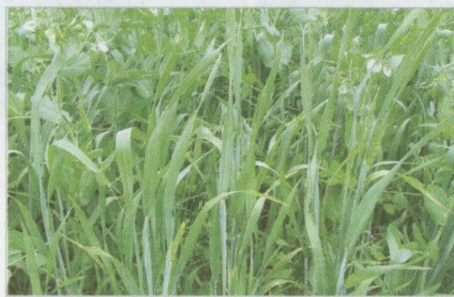
Obr. 1 - Maloparcelkové pokusy - směska hrachu a pšenice

studií může být až šedesát procent fixovaného dusíku využitelných v následujícím roce při produkci následných plodin. Fixovaný dusík nevyužívají pouze luskoviny, ale v případě pěstování ve směskách mají z tohoto procesu užitek i další komponenty směsky. Problémem je však zvýšená citlivost luskovin na různé výkyvy v prostředí, která je příčinou jejich výnosové nestability. Tato citlivost se týká