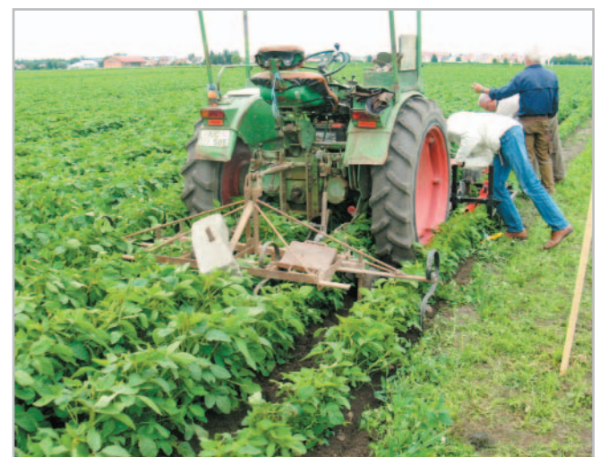
Čtyřřádková plečka v porostu sóji

Sklizeň samotného porostu provádíme v co nejnižší výšce, abychom dokázali sklídit i nejnižší nasazené lusky. Zde oceníme jarní urovnání povrchu. Též je vhodné pro sklizeň využít sklízecí mlátičku s užším žacíím ústrojím. Musíme dávat dobrý pozor na kontaminaci sójových bobů půdou. Takto znečištěné bobky jsou vhodné pouze ke krmným účelům, a tím do-