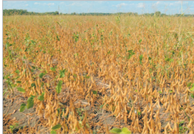
Porosty biosóji v různých stadiích vegetace