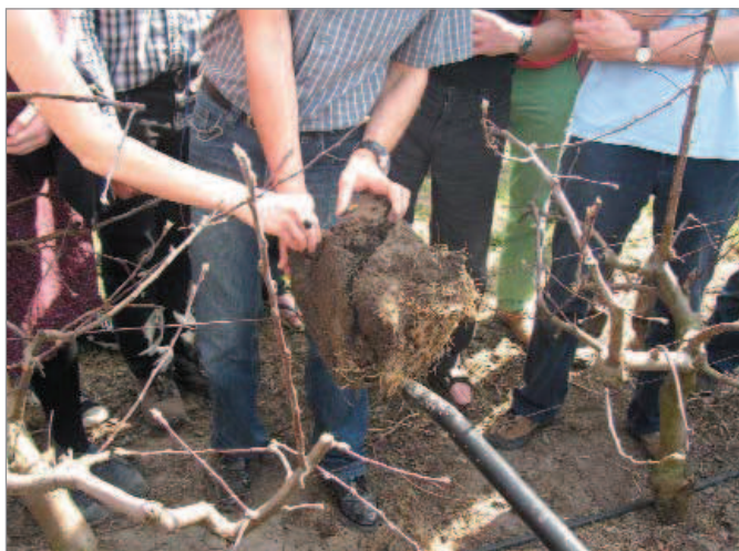
Rýčovou metodou zhodnotíme fyzikální i biologické vlastnosti půdy na stanovišti.

Podpořeno z programu švýcarsko-české spolupráce a Ministerstvem zemědělství ČR.