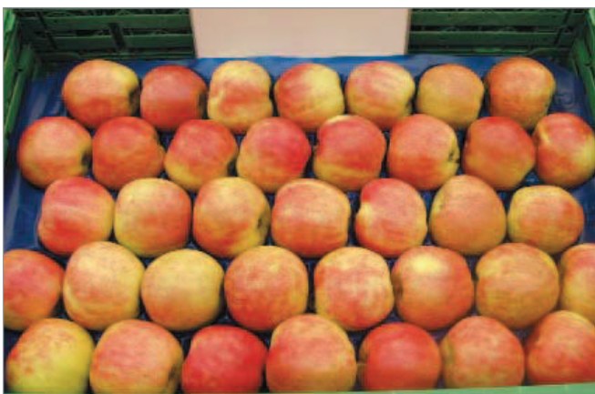
Staré odrůdy pěstované tradičně na vysokokmenech mohou být v ekologickém sadáření příjemným zpestřením sortimentu. Odrůda Grávštýnské patří mezi nejchutnější.