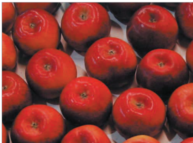
Česká odrůda Topaz je nejrozšířenější rezistentní odrůdou v intenzivních ekologických sadech

Po krátkém úvodním vstupu věnovanému seznámení s principy ekologického zemědělství a podání stručných informací o situaci v Evropě a ve Švýcarsku, např. o činnosti sva- zu Bio-Suisse, zahájil lektor první den