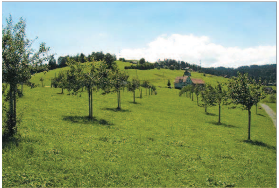
Špičková úroveň ovocnářství na vysokokmenech ve Švýcarsku

Myslím, že velice cenné byly poznatky týkající se intenzivního ekologického pěstování peckovin , které se u nás netěší takové pozornosti jako jaderoviny, respektive jabloně. Ve Švýcarsku je značná poptávka po velkoplo-