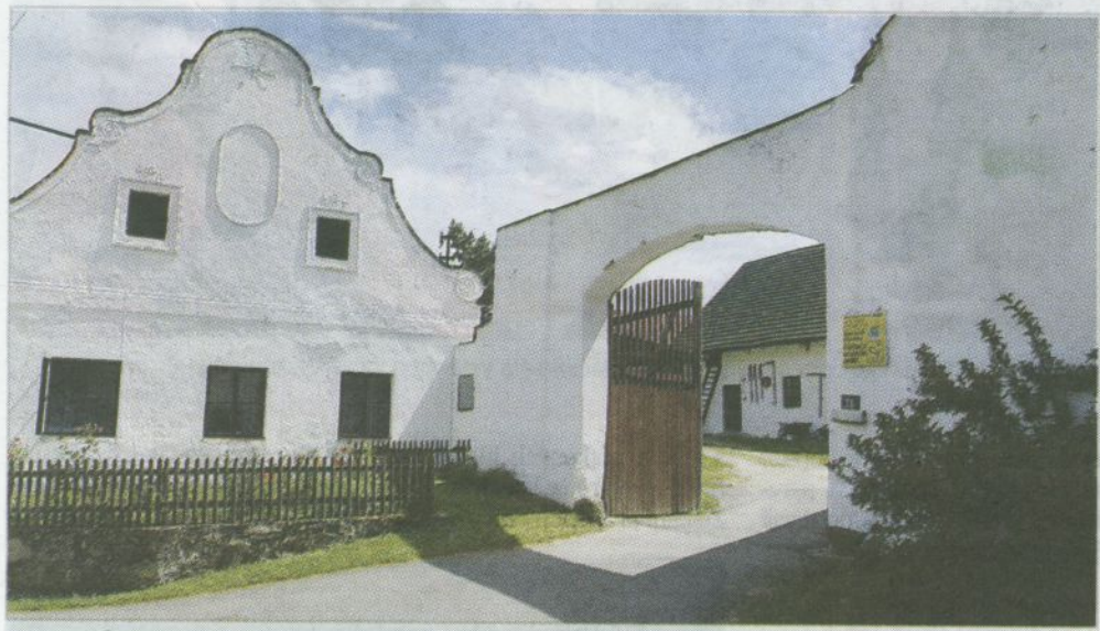
Rodinné farmy navazují na zpřetranou tradici sedláctví (ekofarma KOFA, Bilsko)

míst i pevných sociálních vazeb ve venkovské krajině – to jsou atributy, které po staletí rodiny sedláků zajišťovaly. Na kontinuitě selského stavu bylo postaveno a stále z něj velkou měrou čerpá i evropské zemědělství.