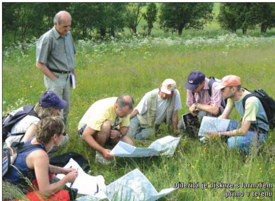
Důležitá je diskuze s farmářem přímo v terénu