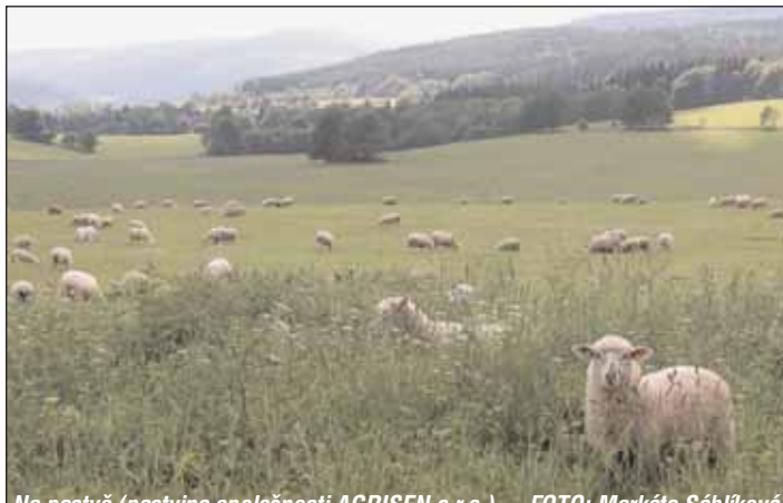
Na pastvě (pastvina společnosti AGRISEN s.r.o.)

Od loňského roku pro ekozemědělce zapojené do projektu "Ekozemědělci přírodě" zpracováváme farmerní plány. Cílem těchto plánů je navrhnout management hospodaření tak, aby byl zohledněn v nejvyšší možné míře šetrný přístup k životnímu