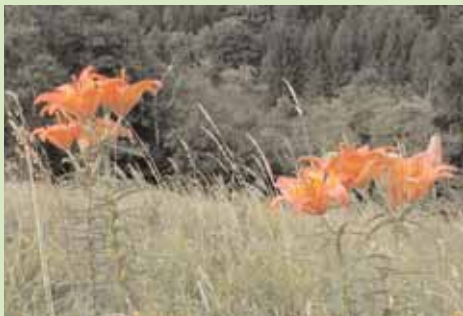
Lilie cibulkonosá

Podmínkou získání dotace na zmíněné opatření je minimálně jedno posečení pozemku s tím, že první seč může být provedena nejdříve 15. srpna. A tak jsme se dostali k zarostlým loukám. Příznivým prostředím pro hnízdění chřástalů a vy-