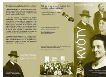
Prosazení kvót pro ženy do politiky – leták

Aktivita: Ve třech vybraných městech proběhly diskuse s ženami kandidujícími do Poslanecké sněmovny za parlamentní politické strany. Diskuse v Praze se uskutečnila ve spolupráci s Fórem žen, díky čemuž jsme nejen obnovily s touto organizací spolupráci,