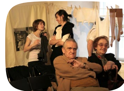
Ženský bytový seminář