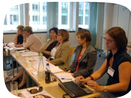
projekt Do Norska a s Norskem za Chartou rovných příležitostí žen a mužů na úrovni měst a obcí – studijní cesta českých regionálních političek, Oslo

Aktivity: V srpnu 2009 jsme zorganizovaly studijní pobyt v Norsku pro 8 českých komunálních političek. Probíhal formou intenzivních workshopů, hlavním tématem bylo prosazování rovných příležitostí na komunální úrovni. Političky měly mj. možnost setkat se s představiteli/kami norských měst, která k výše zmiňované Chartě již přistoupila, a diskutovat s nimi praktické využití tohoto dokumentu. V září 2009 jsme uspořádaly mezinárodní konferenci, která si kladla za cíl představit dokument Charty co nejširšímu publiku. Příspěvky přednášejících, články expertů/tek na genderovou problematiku a přetisk Charty jsou shrnuty v brožuře s názvem Rovné příležitosti žen a mužů na úrovni života ve městech a obcích: Jak začít? Největším úspěchem projektu je získání prvních českých signatářských obcí – Staňkovic a Milotic. Ceníme si také navázání mezinárodní