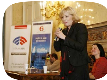
3. Sympozium České Prezidentky

Klub političek je nadstranická členská platforma političek z celé České republiky, která je místem podpůrných setkávání, sdílení informací, názorů a vzdělávání. Klub byl založen