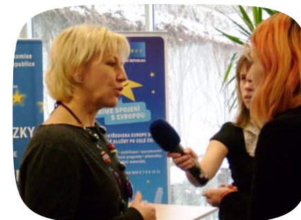
Kulatý stůl o ženách v politice a volbách do Evropského parlamentu – eurokomisařka Margot Wallström

v roce 2008 (?) a v současné době je v něm sdruženo 24 žen z šesti politických stran, včetně bezpartijních. Členky se scházejí několikrát ročně na uzavřených setkáních, minimálně 1x ročně na večerní akci s doprovodným programem, mají přednostní vstup na slavnostní a odborné akce Fóra 50 %, jsou zařazeny do unikátní Databáze političek, která byla spuštěna na našich webových stránkách v témže roce.