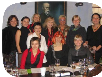
Setkání Klubu političek s Ivetou Radičovou