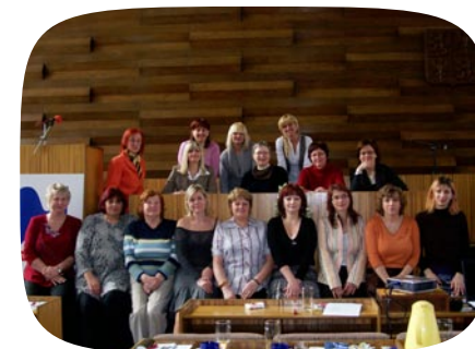
projekt Filia – setkání regionálních političek v Ústí nad Labem

spolupráce s KS (Norský svaz měst a obcí) a CEMR (Rada evropských místních a regionálních samospráv).