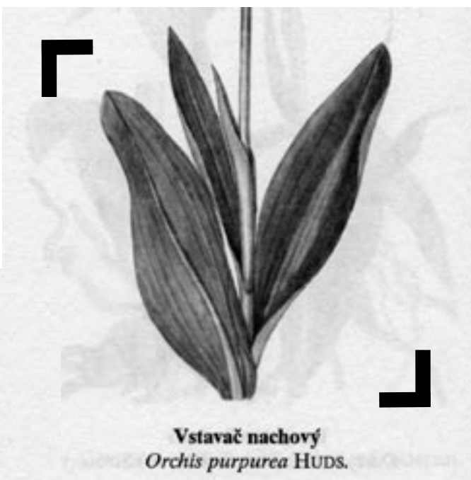
Vstavač nachový Orchis purpurea HUDS.

Na svědeckém vrchu Chotuc na Nymbursku roste jedna z našich největších populací vstavače nachového u nás. Tato rostlina patří mezi orchideje a je zákonem chráněná. Klub za záchranu Polabí ve spolupráci se ZO ČSOP Orništa uspořádal druhý zářijový víkend brigádu. Jejím cílem bylo odstraňování náletové vegetace, která vstavačovou louku na Chotuci zarůstá. Děti Země na Chotuci pracovaly již dvakrát v 90. letech. Od té doby se počet kvetoucích orchidejí několikanásobně zvýšil. Jiří Řehounek.