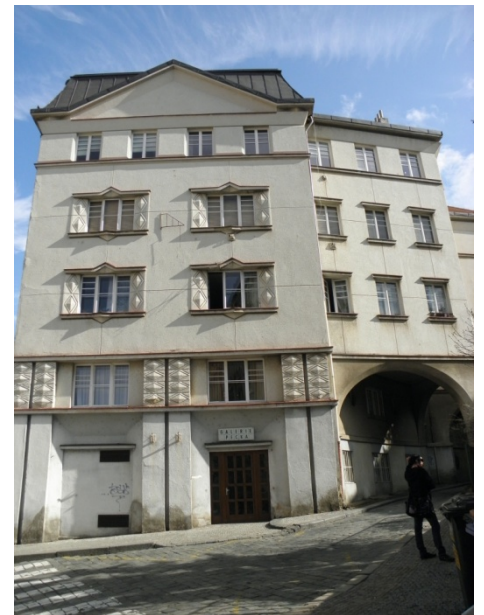
kubistický dům ve Vratislavově ul.

Odpověď: Dosud nedořešeno. Problém je v metodice znalce ocenění srážkovým koeficientem za obsazené byty se smlouvami na dobu neurčitou v domě. Právce, zejm. TOP 09 nesouhlasí. Počítá se s dvojnásobným oceněním domu jako celku a bytů v nich i jednotlivě.