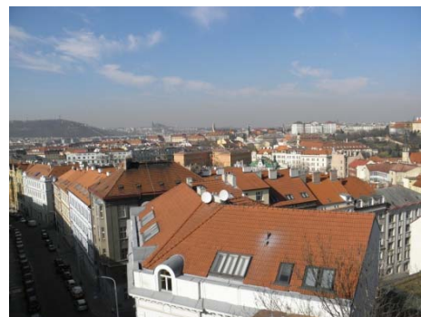
Podskali jako na dlani