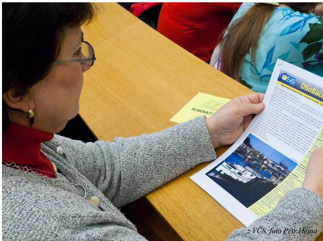
z VČS, foto Petr Hejna