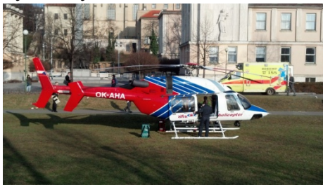
nouzový heliport v Žitkových sadech, foto

Celý případ vnímáme jako pozitivní signál svědčící o tom, že podivné praktiky, na které členové občanského sdružení Občané za spokojené bydlení upozorňovali již od září 2010, začínají být řešeny se vši vážností.