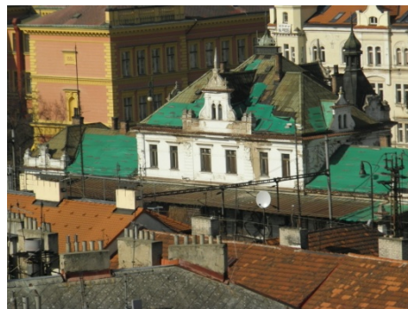
nádraží Praha – Vyšehrad od jihu

Odpověď: požádejte o vyjádření bytový odbor radnice. Někdy jsou byty volné proto, že se např. vede soudní spor o nájemní smlouvu apod., těžko říci. Nicméně na velké množství volných bytů nás členové upozorňují velmi často. Máme k dispozici starší seznam volných bytů. Vždy je dobré konkrétně oslovit radnici a chtít vysvětlení, informování skutečně ze strany radnice nejsme