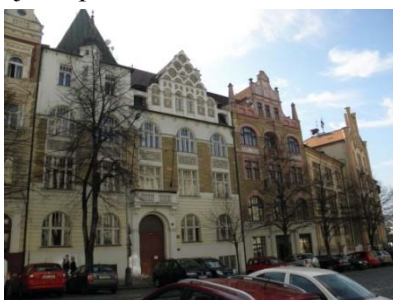
domy ve Vratislavově ulici