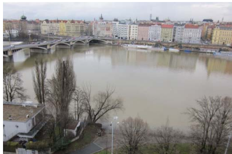
Dolní Podskali s Jiráskovým mostem