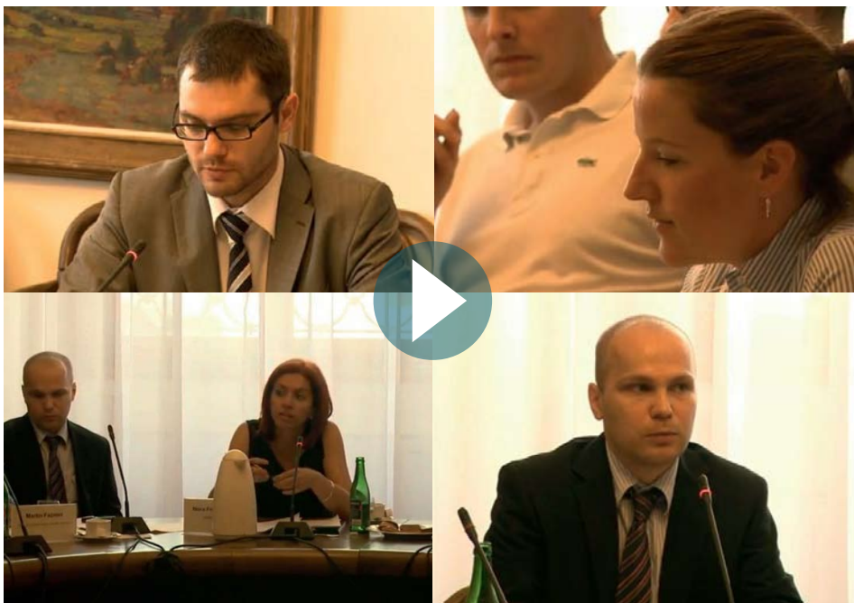
VIDEO: Záznam ze semináře v poslanecké sněmovně na téma rozšíření pravomocí NKÚ.