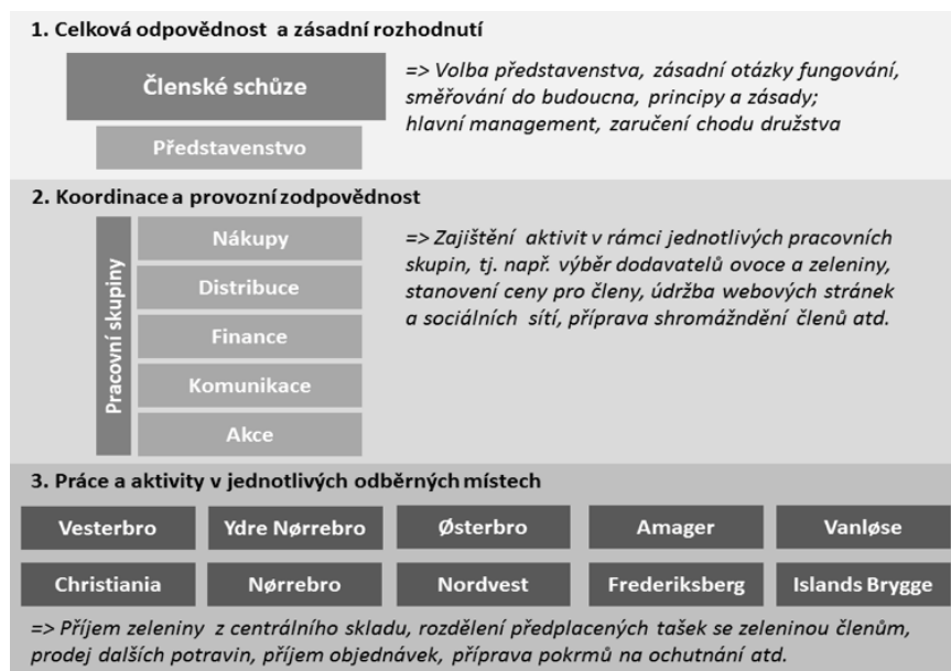
Diagram 2. Organizační struktura družstva KBHFF

Struktura družstva se díky vzrůstajícímu počtu členů postupně vyvíjela a stále se vyvíjí. V současnosti je KBHFF organizováno na třech základních úrovních (Diagram 2). První úroveň zahrnuje představenstvo a členské schůze, které zajišťují chod družstva na nejvyšší úrovni, tj. mají na starosti hlavní rozhodnutí o současných a budoucích aktivitách KBHFF. Druhá úroveň se týká pěti pracovních skupin, které zajišťují aktivity na úrovni celého družstva v oblasti nákupů a distribuce ovoce a zeleniny, finančních otázek, komunikace se členy a okolím a akcí pořádaných družstvem. Třetí úroveň se pak vztahuje k 10 odběrným místům situovaným v různých částech Kodaně a jejich aktivitám (Diagram 2).