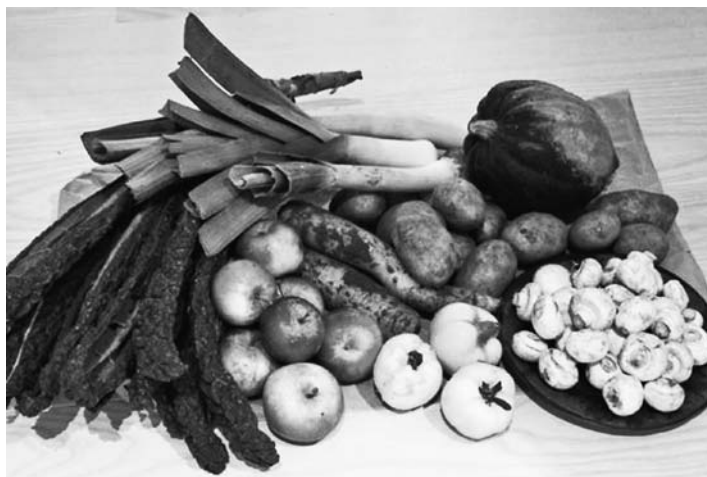
Diagram 4. Obsah pytle družstva KBHFF v listopadu 2012; člověk si díky družstvu, jako je KBHFF, rozšíří obzory o místní produkci, kterou by v supermarketu jen tak nenašel – tři „hrušky“ uprostřed na obrázku jsou ve skutečnosti kdoule, ovoce původem z jihozápadní Asie, které je velmi aromatické a výborné zejména do koláčů a různých zavařenin (tepelná úprava je před konzumací nutná).

Zpočátku se pro balení ovoce a zeleniny pro členy využívaly hnědé papírové pytle, postupem času se však z ekonomických i environmentálních důvodů přešlo na velké hnědé tašky z biobavlny s Fairtrade certifikací z Indie. Na každou tašku je záloha 100 DKK a vždy, když si člen vyzvedává svou objednávku, musí odevzdat také prázdnou tašku nebo si za 100 DKK koupit tašku novou. Odpadá tím potřeba výdajů na stále nové pytle a redukuje se množství odpadu vyprodukovaného družstvem.