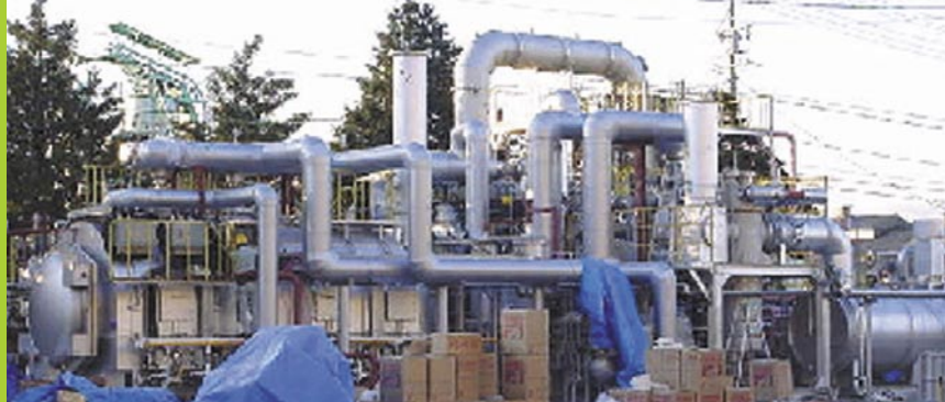
Zařízení firmy Eco-Logic (proces Gas-Phase Chemical Reduction) patří mezi technologie s nejvyšší účinností destrukce perzistentních organických látek.

Při úplném posouzení technologií vycházejí ze soutěže se spalovna- mi či pálením odpadů s PCB v cementárnách lépe některé chemické metody destrukce (například proces Gas-Phase Chemical Reduction). Demonstrační projekty započaté díky Stockholmské úmluvě vyzkoušejí tyto metody na Filipínách (k destrukci PCB, které zbyly ve vojenských základnách USA) a na Slovensku. Snad pomohou rozšíření této cesty šetrnější k životnímu prostředí.