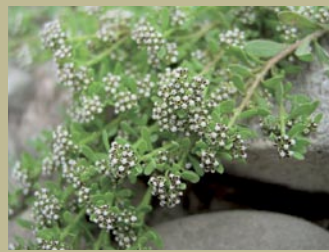
POSLEDNÍ MOHYKÁN? ■ Drobnokvět pobřežní roste v České republice pouze na tomto jediném úseku Labe.

Prezidentu ČR, vládě ČR, Parlamentu ČR, ministru životního prostředí, ministru dopravy a spojů, ministru pro místní rozvoj, České inspekci životního prostředí, Krajskému úřadu Ústeckého kraje, primátorům, magistrátům a zastupitelstvům měst Děčína a Ústí nad Labem, starostovi, zastupitelstvu a Obecnímu úřadu v Hřensku.