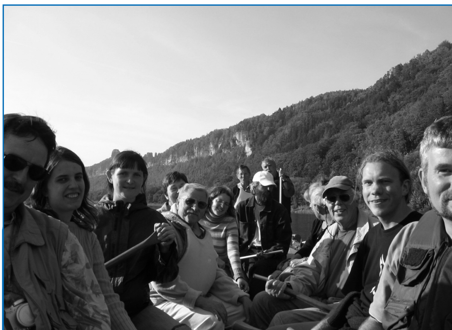
Vědci, politici i umělci diskutovali o budoucnosti Labe přímo na jeho hladině.

Pak již snášíme čluny k vodě. Vyslechneme si ještě krátkou instruktáž, jak se na člunech chovat, bereme do rukou pádla a vyrážíme. pokračování na str. 3 ►