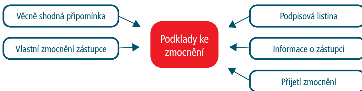
Schéma: Co je třeba doložit ke zmocnění zástupce veřejnosti?

Stavební zákon sice neříká, jaké údaje by měla uvést právnická osoba, která by byla zástupcem, ale lze očekávat, že by to měl být alespoň název, sídlo, IČO a statutární zástupce.