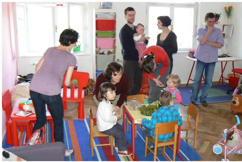
foto: rodiče s dětmi v EPSíku

Vzhledem k tomu, že jde o sporadické hlídání dětí, kdy děti v koutku netráví celý den, není koutek náročný ani na prostor, může být zřízen v prostorách zaměstnavatele. Za ideální pak považujeme, aby součástí koutku bylo i místo, kde mohou rodiče pracovat na počítači, vyřizovat telefonáty či jinak pracovat. Nemusí totiž odcházet daleko a neztratí tak drahocenný čas přesunem z místa na místo. Další výhodou je, že v případě potřeby jsou svému dítěti rychle na blízku, což ocení zejména rodiče nejmenších dětí.