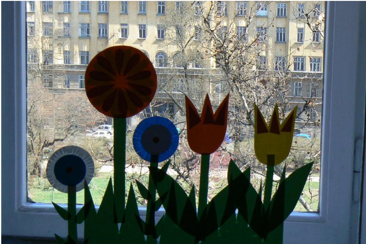
foto: pohled z okna EPSíku

Mnohokrát děkujeme všem, kteří nás podpořili a podporují. Jsme nevládní, nezisková organizace a naše činnost je závislá na podpoře veřejnosti. Pokud se Vám zdá naše práce prospěšná, zvažte prosím, zda nám můžete pomoci.