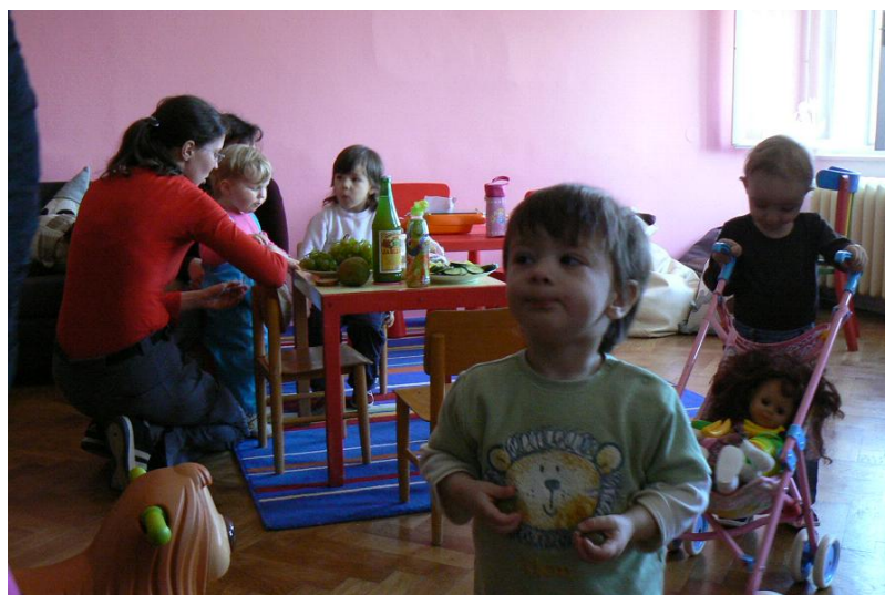
foto: děti a rodiče v EPSíku