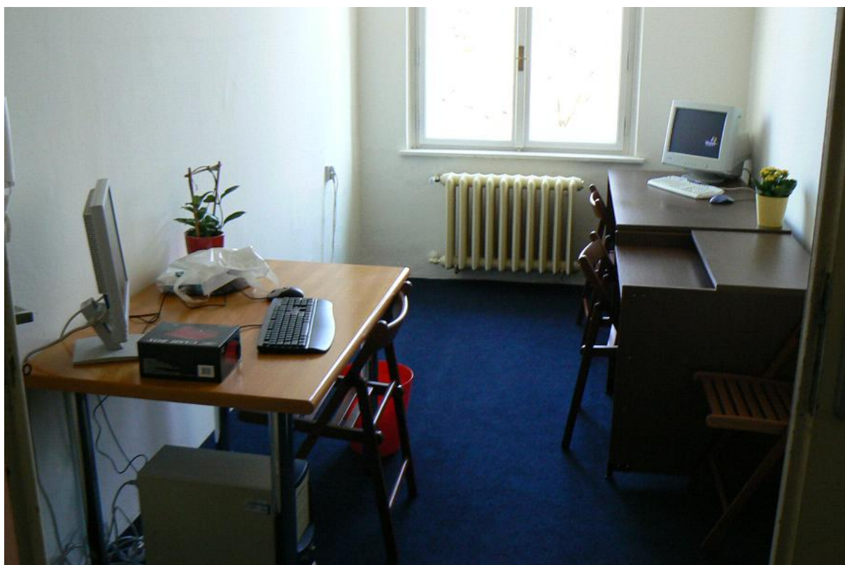
foto: pracovna pro rodiče v EPSíku

Sdílení pracovního místa je v České republice forma práce, jež je velice neobvyklá. Jde o zaměstnání dvou osob na jedné pozici, které se o práci dělí. Každý z těchto zaměstnanců je zaměstnán na částečný úvazek, klasicky např. můžeme uvažovat o dvou polovičních úvazcích. Práce se může střídát např. tak, že jeden zaměstnanec chodí do práce dopoledne, druhý odpoledne, případně lze práci vystřídat v polovině pracovního týdne atp. Tato forma práce má velký význam pro zaměstnance s malými dětmi, neboť jim vychází vstříc se zavedením zkrácených pracovních úvazků, o které mají zájem. Je ovšem pravda, že pro zaměstnavatele může kromě benefitu udržení kvalifikovaných zaměstnanců s rodinnými povinnostmi znamenat větší administrativní zátěž. To by v budoucnu mohlo zmírnit opatření, jež vládnoucí politické strany zakotvily do koaliční smlouvy, ve které se zavazují, že „ stát uleví firmám na sociálním pojištění 7 200 Kč ročně za každý částečný úvazek pro rodiče s dětmi do 6 let, zdravotně postižené nebo pro pečující o handicapované “. 3