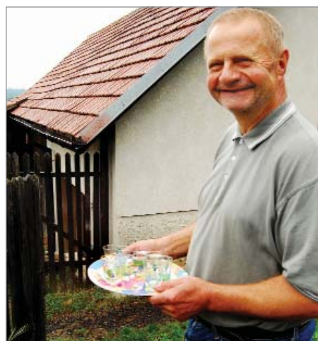
Na samotě u Hrabáčků je veselo...