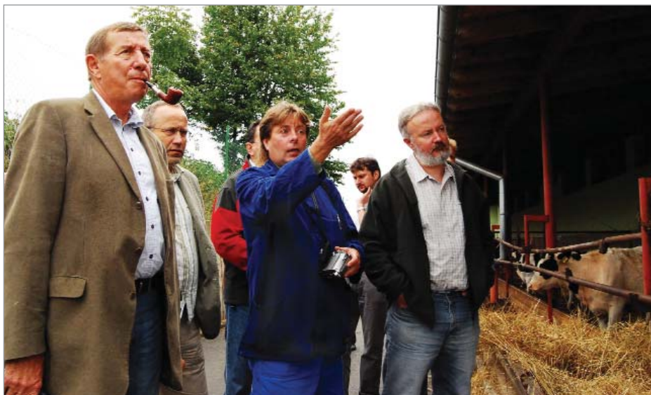
Ing. Jakub Šebesta ministr zemědělství České republiky na farmě AGROFYTO

ma v kuchyni, a tak jejich voňavému pohostění, které připravili, nikdo neodolal.