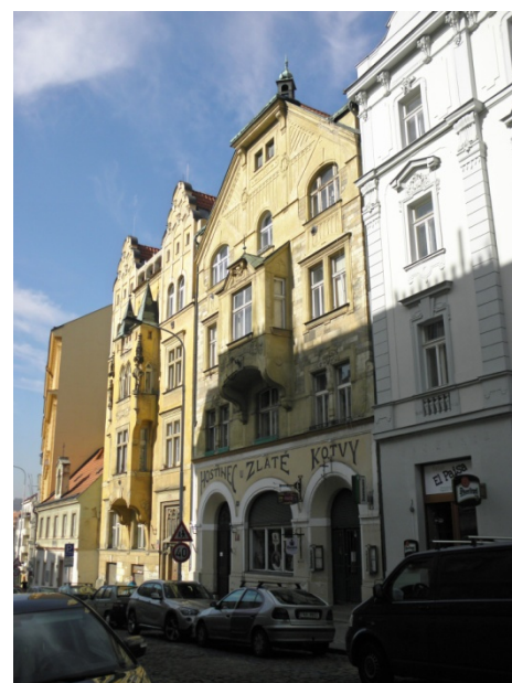
Dům U zlaté kotvy, foto Otto Hoffmann