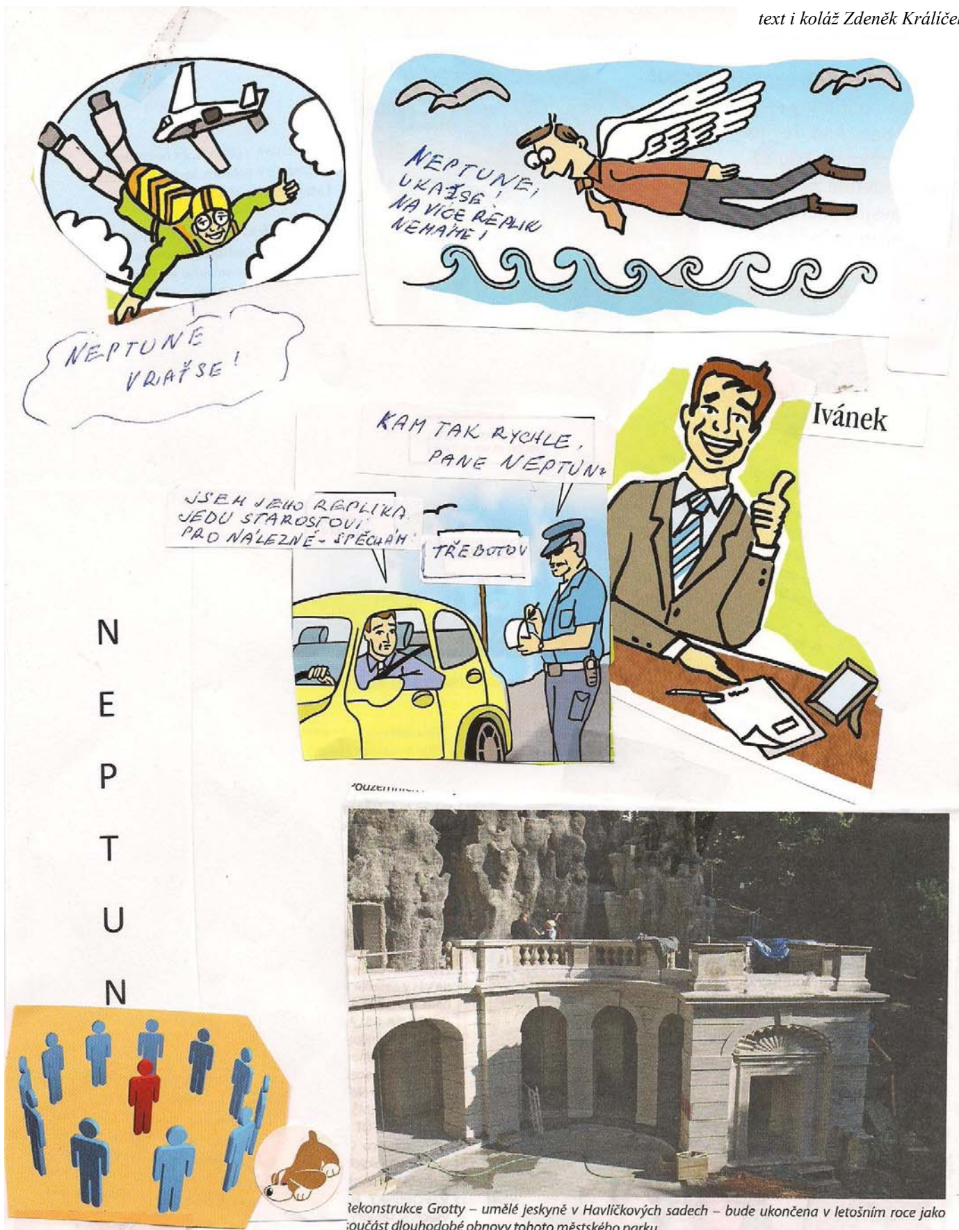
Rekonstrukce Grotty – umělé jeskyně v Havlíčkových sadech – bude ukončena v letošním roce jako součást dlouhodobé obnovy tohoto městského parku.