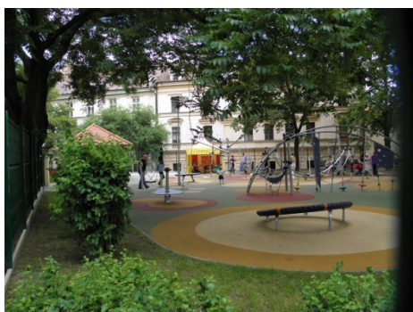
Ilustrační foto Otto Hoffmann