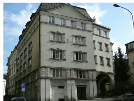
kubistický dům, foto Otto Hoffmann

Nicméně jsem předpokládal, že vše je perfektně připraveno a nasvědčoval tomu i záměr jmenovat za odešlé funkcionáře ČSSD zastupitele TOP 09. Ti jsou známí kolegové dosavadní koalice, tak šup s nimi do volby. Ejhle, zádrhel. Opozičníci OSB začali klást dotazy nad VIP postavením nejmenší strany zelených, na což již kriticky poukazovala TOP 09 při vzniku původní koalice. Různé vytáčky a nejasnosti zatrhla paní zastupitelka Udženia, co že za divadlo zde provozují OSB, i když s divadlem, jak výše uvedeno, začala koalice svými „personálními změnami“. Tím málem založila „Itálii“ s paní starostkou, která ovšem disciplinovaně přistoupila ke opětovnému představení „nových kandidátů“ za TOP 09 a posléze k manifestační volbě každého z nich. OSB si nevyzvedla lístky a čtyři hlasy proti obstaraly ČSSD. A tak si dočasně oddechl i návrhový a volební výbor.