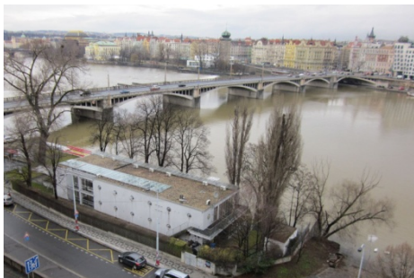
Jiráskův most

Další kauza atentátu na OSB přichází v zápětí. OSB schválilo, aby byly dodatečně zařazeny do prodeje domy výhradně po bytech, kdy výnosnost nebytových jednotek v domě přesahu-