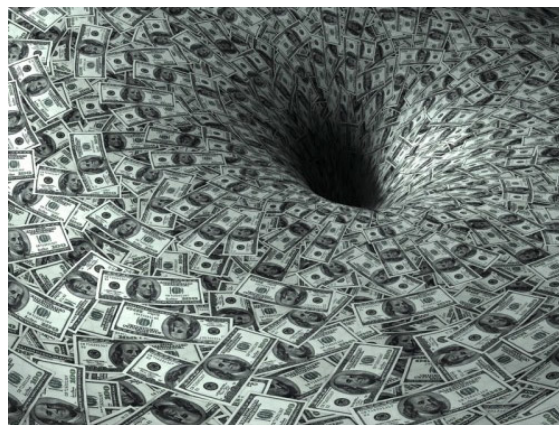
pěněžní černá díra, převzato z Internetu