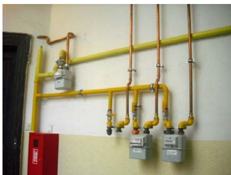
"dvorek" neexistuje, jen jakýsi podivný nezkolaudovaný a zatuchlý ateliér.