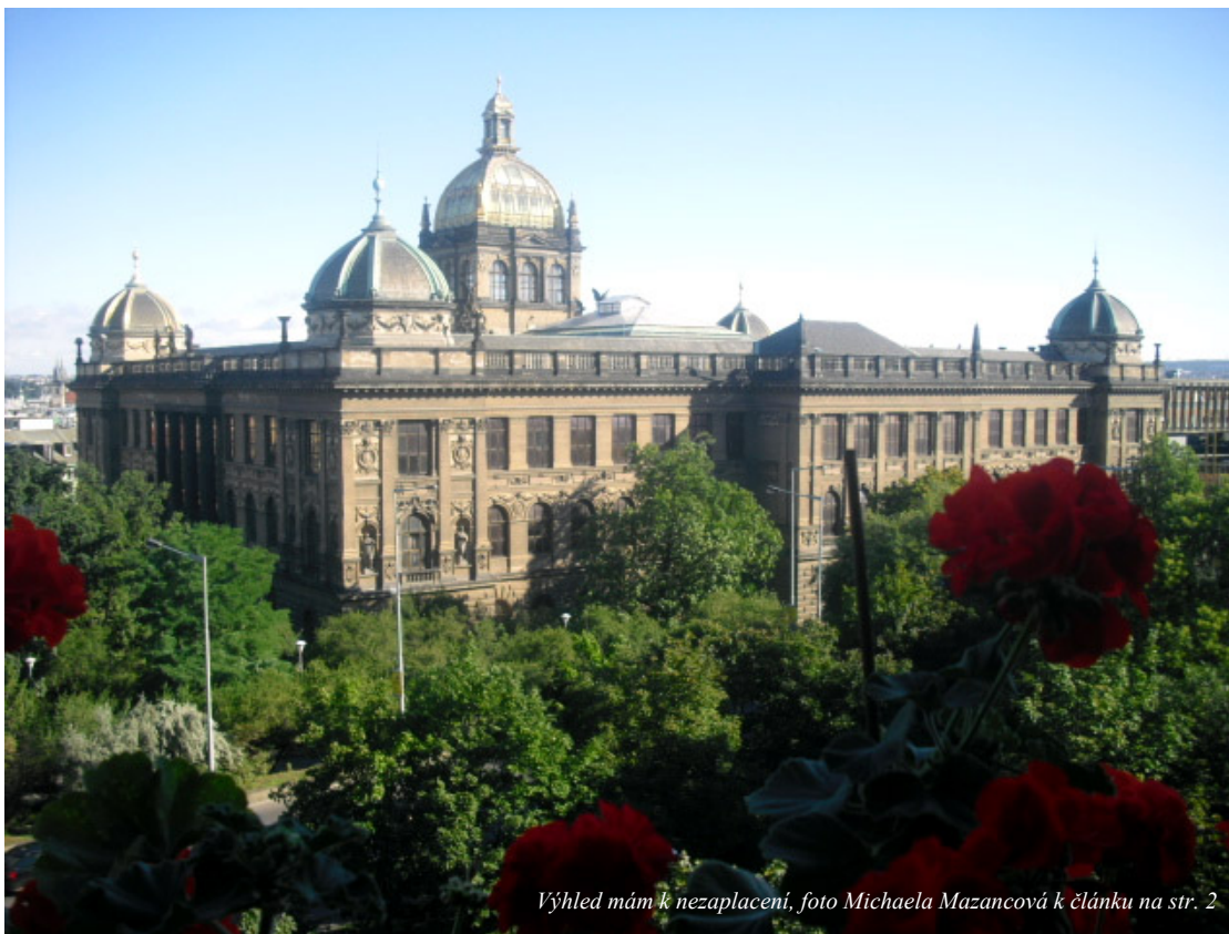
Výhled mám k nezaplacení, foto Michaela Mazancová k článku na str. 2