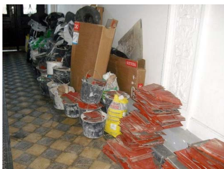
sklad materiálu na chodbě během stavby, že překáží nájemníkům a nijak hezky nevypadá, nikoho nezajímalo