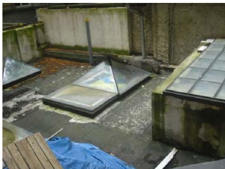
Nájemníci se rok a půl snaží s radnicí dohodnout na odstranění stavby, což se nepodařilo. Snad bude obnoven alespoň původní dvorek a dům bude možné odvětrat. Výhled z oken do dvora je pro estéty k neunesení...