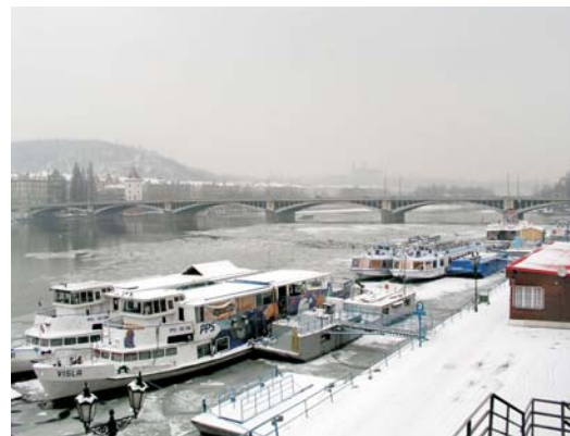
Ilustrační foto OH