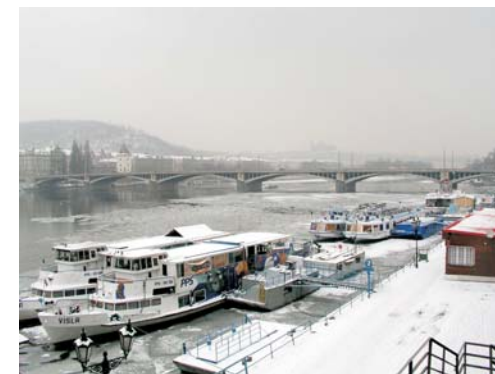
Přístaviště, ilustrační foto OH