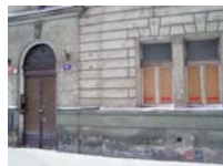
Dům po osmileté "pěči" italského majitele, ilustrační foto PK

I. Oprávněným nájemcům, kteří nevyužili možnost odkoupit bytovou jednotku na základě závazné nabídky učiněné MČ Prahy 9 pod-