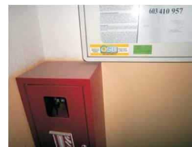
Podlaha a tlačítka výtahu (vlevo a uprostřed), prach na skříně na chodbě