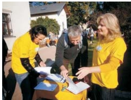
Zahájili jsme sběr podpisů pod volební ptici (viz text na další straně)