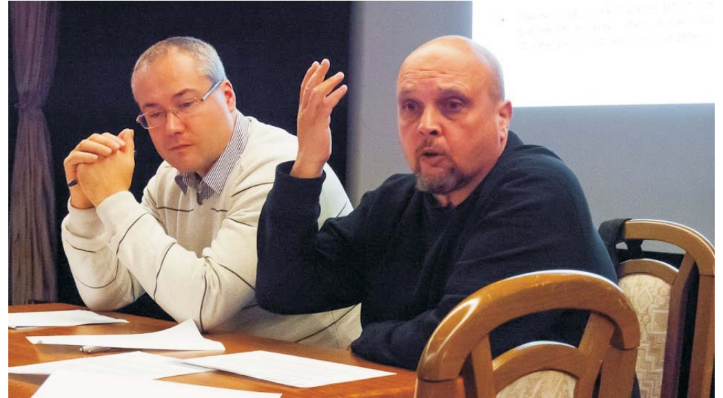
Foto ze setkání s domovními kontakty PH