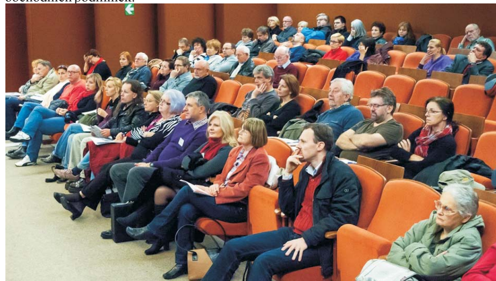
Foto ze setkání s domovními kontakty

Otázka by se vlastně mohla položit i takto: jak získat přízeň občanů, při minimálním vynaloženém úsilí a zároveň nás to nic nestálo? Možná nyní, odvěký sen se stává skutečností. Jako v bajce, kdy se vlk nažere a koza zůstane celá. Stejně tak, jak by se přemýšlivý občan mohl dívat kriticky na získání přízně lidu Cesarem pořádáním her, mohl se dívat na současnou snahu našich politiků představenou v podobě osvětové PR kampani v zářijových novinách Prahy 2. „Chcete-li ušetřit za dodávky energií, přihlaste se do e-aukce“! Přesvědčují nás na hlavních stranách. S podobnou jistotou, která by dala parafrázovat do podoby, ve které se prodejci na předváděcích akcích snaží přesvědčit a prodat nádobí s doživotní zárukou, osobní zodpovědnosti, trvanlivosti a férových obchodních podmínek.