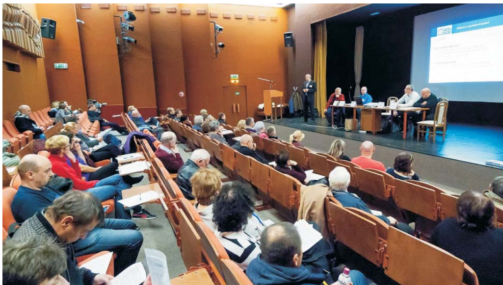
Foto ze setkání s domovními kontakty PH

Obsahuje analytické rozvahy i návrhy, jak by se MČ měla dále rozvíjet. Přílohou je Katalog nemovitých kulturních památek. Vše lze nalézt na webových stránkách Prahy 2. Jenže prokousat se jím, je úkol téměř nadlidský. Stěžejní informace, zejména návrhy co a jak dál, musí i zkušené oko chvíli hledat.