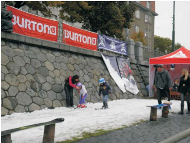
Na Aprée Ski si mohli ozkoušet první lyžařské pokusy i ti nejmenší