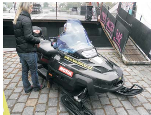
Sněžný skútr na Après Ski poutal největší zájem mrňat, foto OH