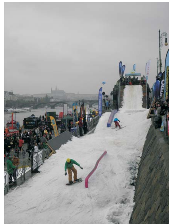
Apres ski - snowbord'áci, ilustrační foto OH

Dokument „Aktualizace programu regenerace městských památkových rezervací a památkových zón MČ Praha 2 2013“ (Program regenerace) je dílo vzbuzující úctu nejen názvem, ale i počtem stránek a množstvím map a obrázků. Bylo s předstihem zveřejněno na webových stránkách MČ. Za to vše se patří autorům poděkovat. Přesto jeho schválení na 17. zasedání ZMČ dne