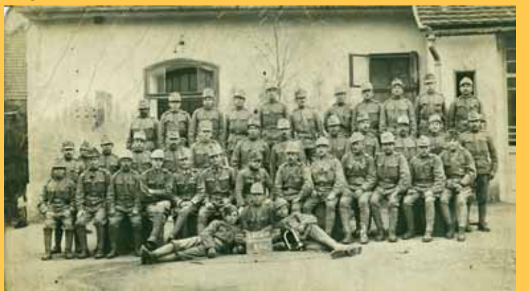
První fotografie z rakouské fronty jsou od Josefa Řejhy