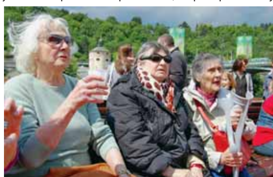
Místo předváděcích akcí je lépe vyrazit na výlet třeba s Centrem sociálních služeb Praha 2 – na snímku účastnice loňského „májového parníku“

že místo zážitku ze slibovaného výletu mu mohou zůstat jen oči pro pláč, prázdná peněženka, podepsané