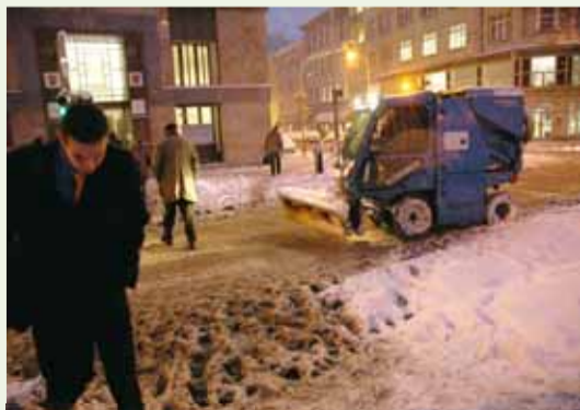
Tramptoty zimy r. 2010

Milí fotografové, zima rozhodně není tím nejpříhodnějším obdobím pro pobíhání po městě a hledání námětů, zato ale nabízí nečekaná překvapení, a ta rozhodně za zachycení stojí. Těšíme se i v tomto měsíci, který je vlastně prvním ryze zimním, na vaše snímky na téma „TRAMPOTY ZIMY VE MĚSTĚ“.