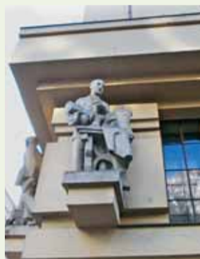
Socha krejčího směřuje do Vinohradské ulice